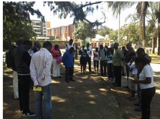
Evangélisation avec les étudiants