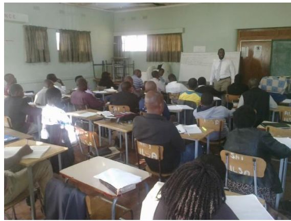
Institut Biblique à Harare, Zimbabwe