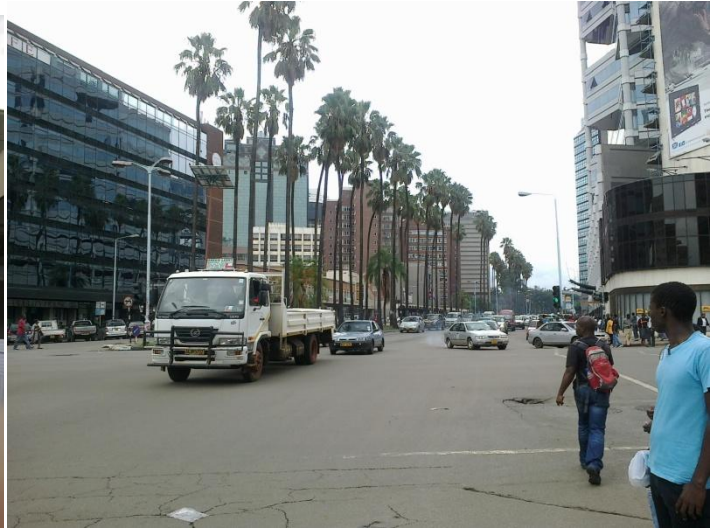
Ville de Harare