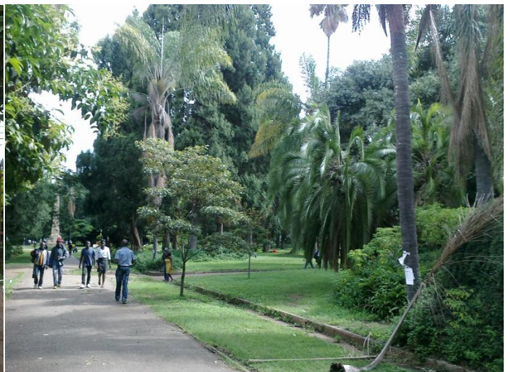
Parc où nous évangélisons