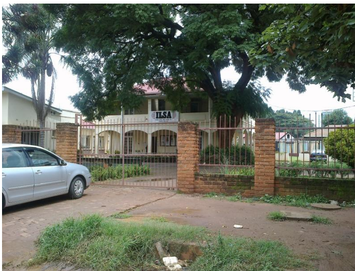
Ecole où nous avons nos cultes